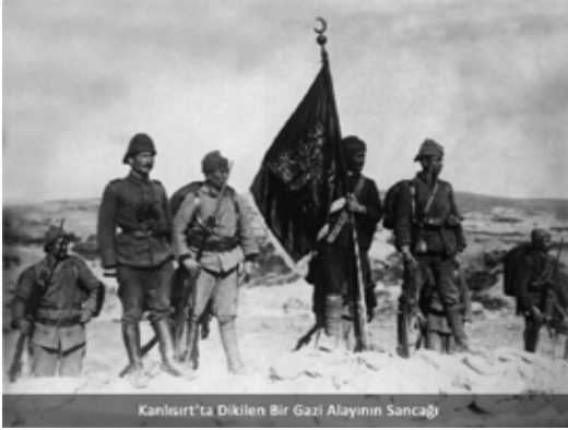
Kanlısirt'ta Dikilen Bir Gazi Alayının Sancağı

Çanakkale Muharebeleri sırasında Türklerle savaştırılmak üzere İngiltere ve Fransa'nın sömürgelerinden getirdiği askerler arasında yirmi farklı millet ve bugün bu milletlerin sahip olduğu bir düzine devlet vardır. Bunlar arasında, Tunus, Cezayir, Fas, Senegal, Mısır, Sudan, Avusturya, Yeni Zelanda, Hindistan, Kanada, İrlanda, İskoçya vd. sayılabilir. Bu yönü ile de Çanakkale Muharebeleri örneğine az rastlanan bir muharebedir.