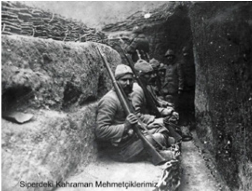
Siperdeki Kahraman Mehmetçiklerimiz

Yaklaşık bir yıla yakın devam eden ve sonuçta Türk ordusunun zaferiyle kapanan Birinci Dünya Savaşı'nın bu en kanlı sahnesine, Türk ordusunun en önemli ve en büyük kısmı iştirak etmiştir. Türk ordusunun bu cephedeki genel kaybı henüz tam olarak tespit edilememiştir. Bu konuda değişik görüş ve rakamlar verilmektedir. Aşağıdaki tablo bu değişik rakamların ortalamasının alınmasıyla yapılmıştır.