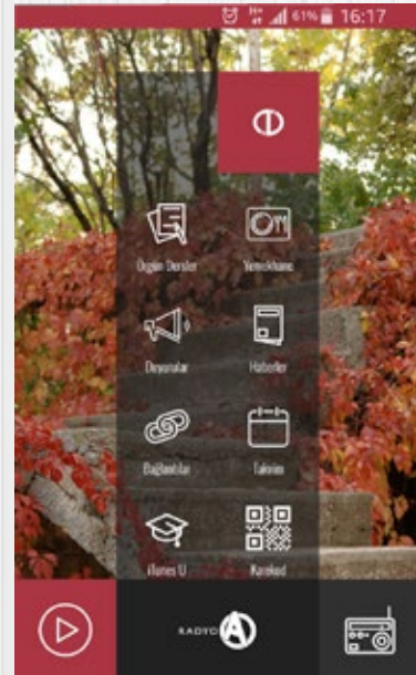
Anadolu Mobil uygulaması

Anadolu Üniversitesinin resmi mobil uygulamaları da son güncelleme ile karekod okutmaya imkân sağlayacak şekilde güncellendi. Kullanıcılar, Anadolu Mobil uygulamasına giriş yaptıktan sonra uygulamada yer alan "Karekod Okuyucu" sayesinde ilgili kodu okutarak içeriğe ulaşabiliyor. Uygulama ayrıca, hangi içeriğe hangi sıklıkla ulaşıldığının bilgilerine erişimi de sağlıyor. Karekod uygulamasının, basım ve hazırlama süreci devam eden Açıköğretim kitaplarında kullanılacağı, konu ile ilgili olarak kitap editörleri bilgilendirilerek Öğrenme Teknolojileri AR-GE Birimi desteğiyle sürecin yönetileceği bildirildi.