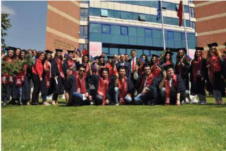
Açıköğretim, İktisat ve İşletme Fakültesi mezunları Açıköğretim Fakültesi önünde

Çoğumuz hayatlarımızı kalabalık kentlerde ve binlerce insan arasında geçiriyoruz. Okumak, bilgiye ulaşmak bizi farklı kılar. Bilginin de iyiye, doğruya ve erdeme yönelik olması gerekir. Buna ulaşmak için de okumamız lazım. Çünkü okumak özgürleştirir." şeklinde konuştu. Vüsale Hasanzade ise "Dünyanın en büyük nüfuslu, en gelişmiş, en girişimci ve en mükemmel üniversitelerinin birinden mezun oluyoruz. Anadolu Üniversitesi bize sadece eğitim vermedi; mücadeleyi, hayallerimizin peşinden gitmeyi öğretti. Biz gençler milletimizin geleceğiyiz. Biz farklıyız çünkü Anadolu Üniversitesiyiz. Bu yolda bana destek olan herkese çok teşekkür ederim." şeklinde duygularını ifade etti.