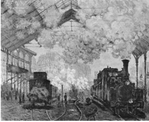
Claude Monet, St.Lazare Garı