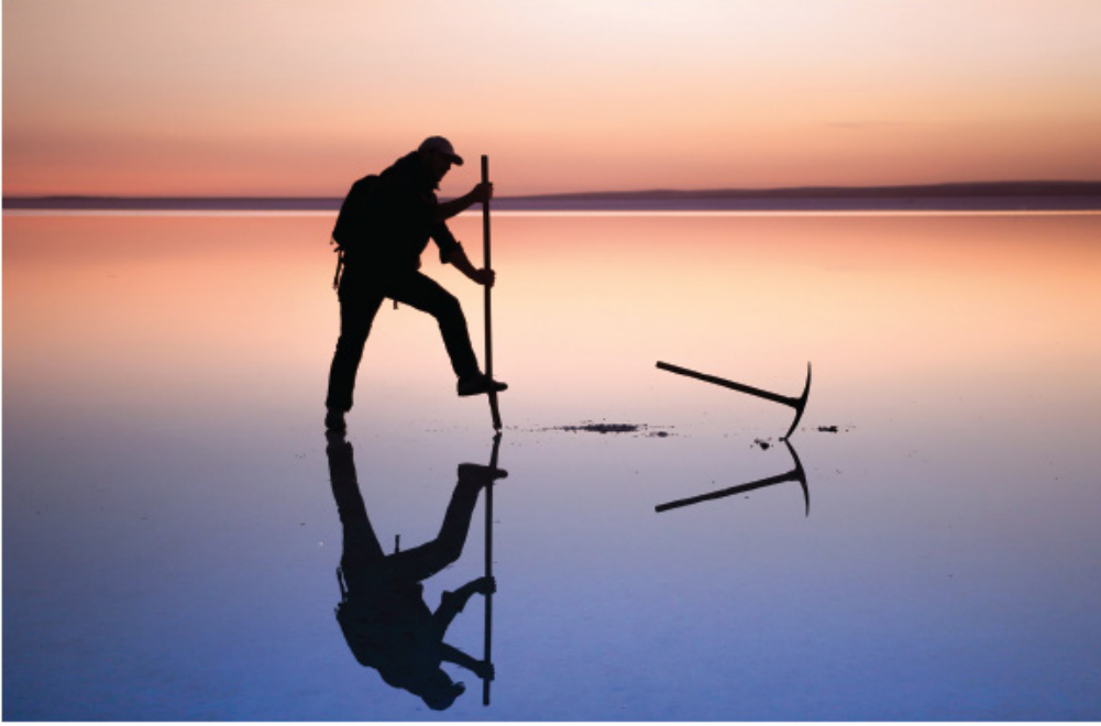
Fotoğraf 8.20 Ayşegül Hilal (AÖF Fotoğrafçılık ve Kameramanlık Programı mezunu-2013)

15- Ünite 8, Sayfa 240, Fotoğraf 8.20 ve Fotoğraf 8.21 eklenmiştir.