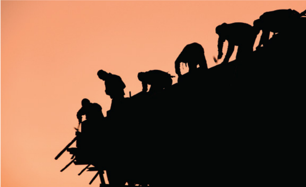
Fotoğraf 8.21 Ayşegül Hilal (AÖF Fotoğrafçılık ve Kameramanlık Programı mezunu-2013)