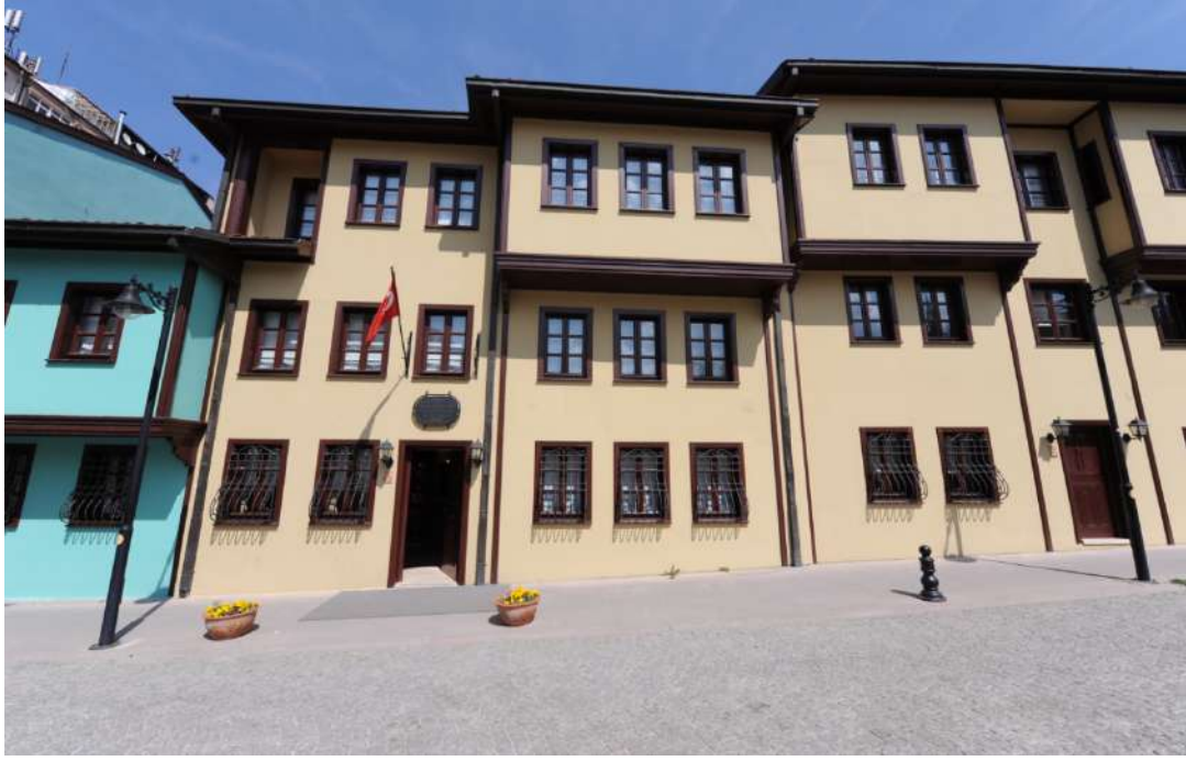
TABLO 46. KONUKEVLERİNDEN 2018 VE 2019 YILLARINDA YARARLANANLARIN SAYISAL VERİLERİYLE KULLANIM KAPASİTELERİ